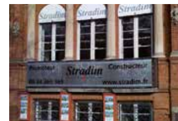
2003 : Création de la filiale Midi-Pyrénées