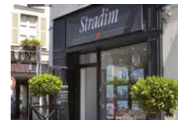
2007 : Création de la filiale Île de France