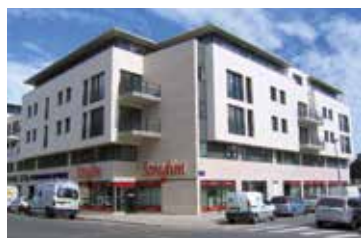
1999 : Création de la filiale Champagne