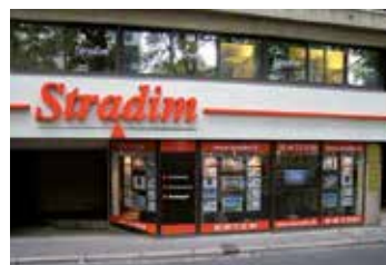
2000 : Création de la filiale Pays de Loire