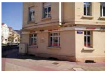
1997 : Création de la filiale Lorraine

Nos équipes développent les opérations et accompagnent les clients dans leur achat depuis notre siège à Entzheim, en périphérie de Strasbourg, et nos agences de Troyes, Melun, Metz, Nantes, Toulouse et Nancy.