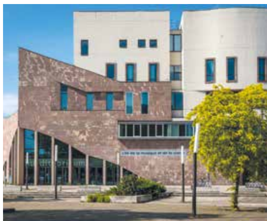
Cité de la musique et de la danse