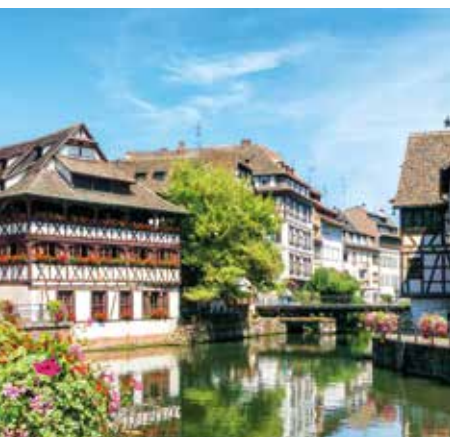
La Petite France

Tournée vers l'avenir , elle relève les défis de la transition écologique pour penser et faciliter la ville de demain. En plus de son appréciable réseau de transports et son engagement pour les mobilités douces, Strasbourg multiplie les initiatives durables au bénéfice de la qualité de vie de ses habitants.