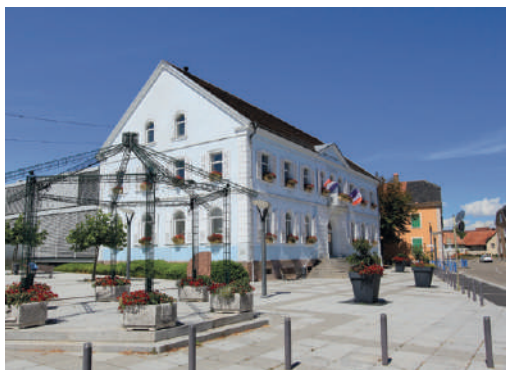
Mairie de Wittenheim

La ville est généreusement dotée en infrastructures culturelles et sportives, qui sont autant d'invitations à la détente : médiathèque, cinéma, école de musique, nombreux complexes sportifs et stades... Avec 13 établissements scolaires jusqu'au lycée, et de multiples possibilités de garde, Wittenheim se prête à l'organisation d'une vie familiale sereine. Commerces et services de proximité simplifient le quotidien et le marché hebdomadaire permet l'approvisionnement en produits frais et de saison.