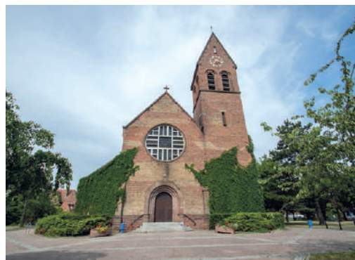
Église Sainte-Barbe de Wittenheim