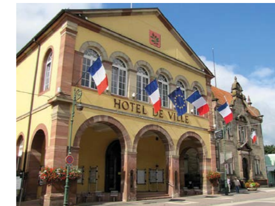
Hôtel de ville

Dotée de nombreux espaces naturels, la ville de Brumath offre une remarquable qualité de vie. Ses habitants jouissent d'un cadre de vie verdoyant où se côtoient nature et biodiversité. Enfants et adultes peuvent se divertir, faire du sport ou se détendre à loisir, en profitant des infrastructures de la ville, ou tout simplement des sentiers de la forêt communale de 458 hectares.