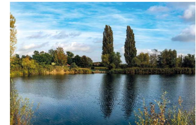
Plan d'eau de la Hardt