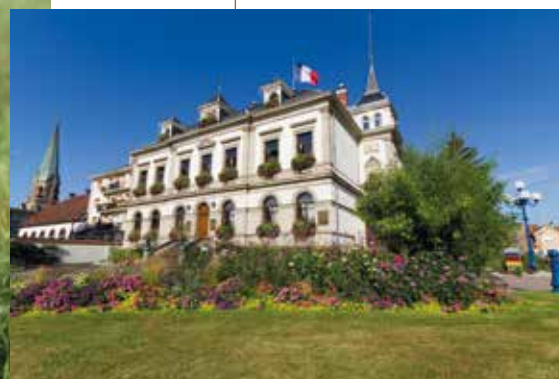
Mairie de Bischheim

Belle Rive séduit par son emplacement idéal, proche des commerces, des établissements scolaires et des services de santé. Bien desservie par les transports en commun, avec une ligne de bus à proximité immédiate, la résidence permet de rejoindre aisément Strasbourg et ses environs.