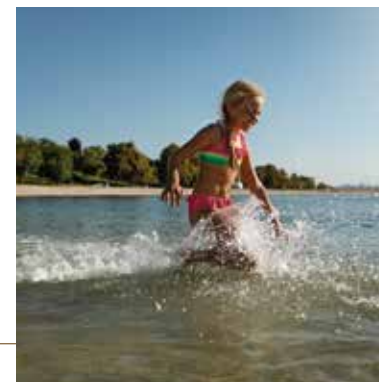
Plan d'eau de la Ballastière